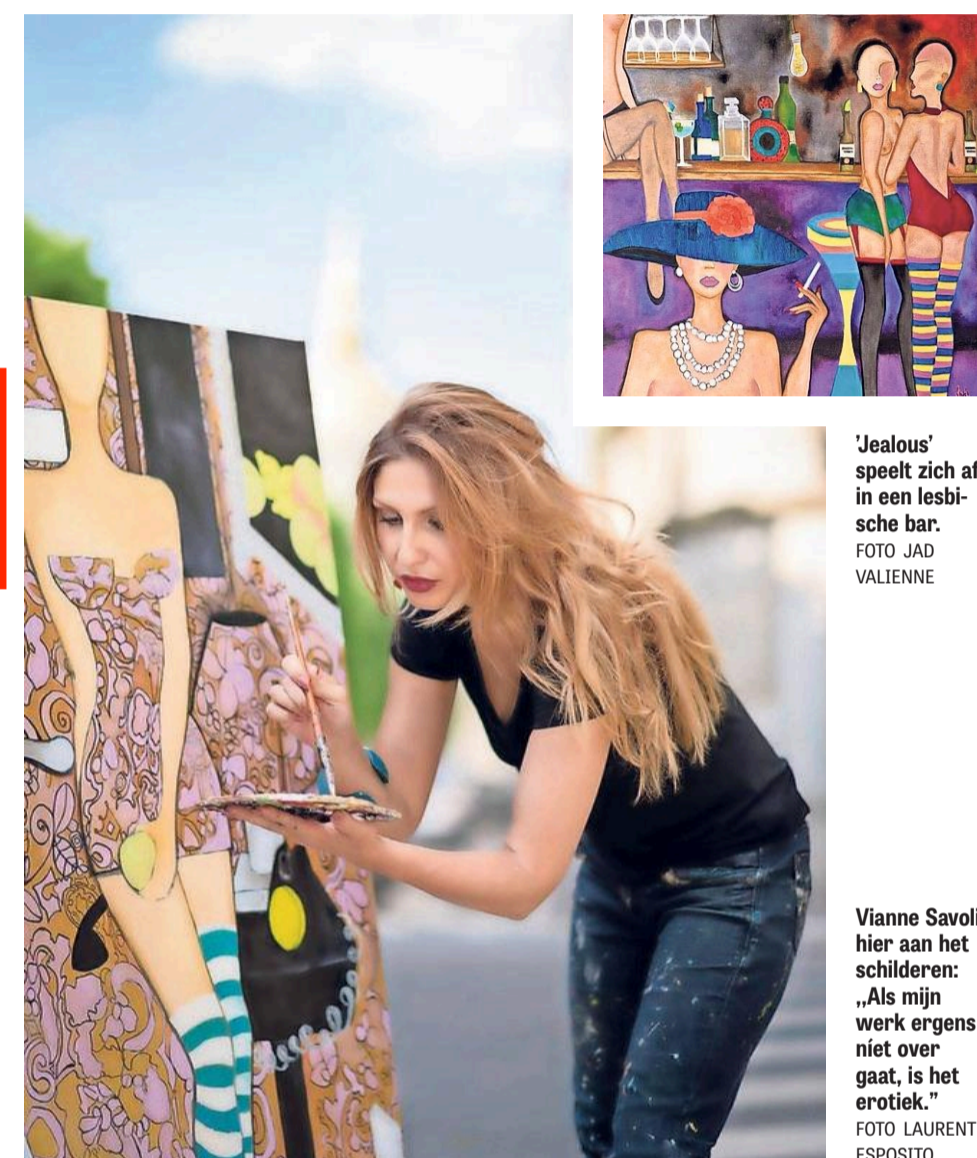
'Jealous' speelt zich af in een lesbische bar.

Savoli werd geboren in Teheran, in het jaar van de revolutie. „De sjah werd afgezet en de islamitische leider Khomeini kwam aan de macht. Het land belandde