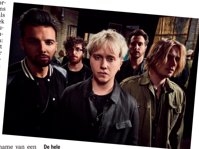
De hele band Nothing But Thieves.

'Broken machine' verschijnt vrijdag, Nothing But Thieves staat 24 november in AFAS Live.