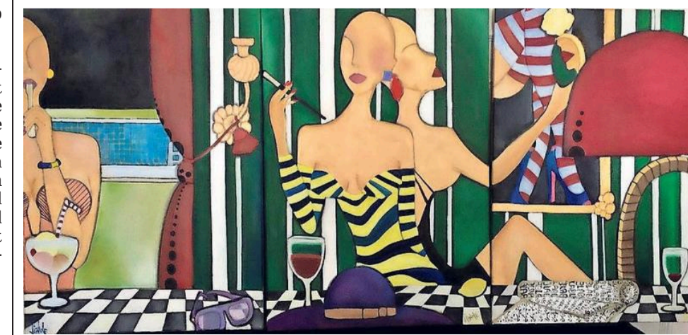
De vrouwfiguren die Savoli schildert, zoals ook hier in het werk 'Diner mondain', hebben geen ogen. „Zo zien mannen vrouwen: een lijf, maar geen eigen identiteit.“

Hier gelden geen religieuze regels, maar ook in Frankrijk kunnen vrouwen zich opgesloten voelen, zegt Savoli. Ze wijst naar een van haar figuren, gehuld in een zwarte body. „Een Française zei tegen mij: ik wou dat ik me zo kon kleden voor mijn echtgenoot. Maar het laat haar katholieke man koud en zij voelt zich er niet vrij genoeg voor. Zelfs in het westen kan het moeilijk zijn om uit zo'n ongewenste situatie te breken.“