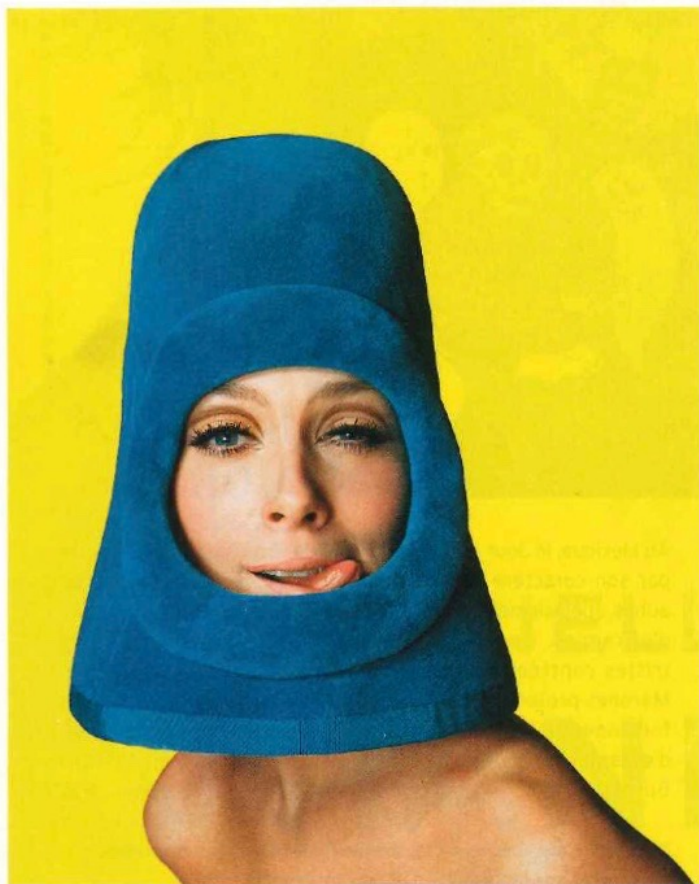
CLUB BY PIERRE CARON

PhotoBrussels Festival, Hangar, 18, place du Châtelain, à 1050 Bruxelles. www.photobusselsfestival.com Jusqu'au 20 janvier prochain.